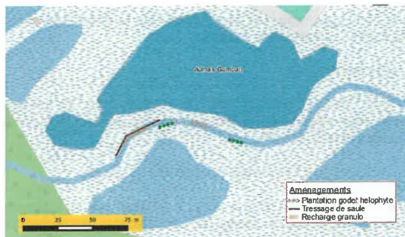
Figure 9 : Localisation des aménagements envisagés en 2021 sur les lots de pêche de Montdidier